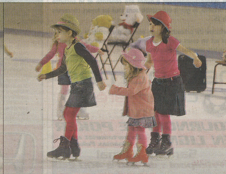
SOLDAT ROSE. Les plus jeunes assureront la première partie.