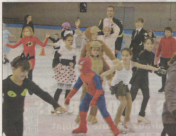
DÉGUISES. Superhéros, poupées et ours en peluche vont mener le bal.

Pratique. Représentation du Soldat Rose arrive en ville , mercredi 16 mai, à 20 heures, à la patinoire municipale de Brive, avenue Léo Lagrange. Tarif adulte : 10 € ; enfant de 5 à 14 ans : 6 € ; gratuit pour les moins de 5 ans. Location des places aux heures du club PAB. Renseignements au 06.85.70.28.96