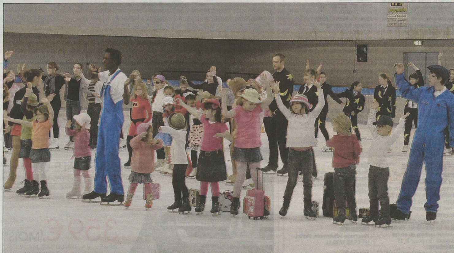
PATINEURS. Petits et grands vont participer à ce spectacle haut en couleurs inspiré de comédies musicales.

La Valse des étiquettes, Gardien de nuit, Un papa, une maman